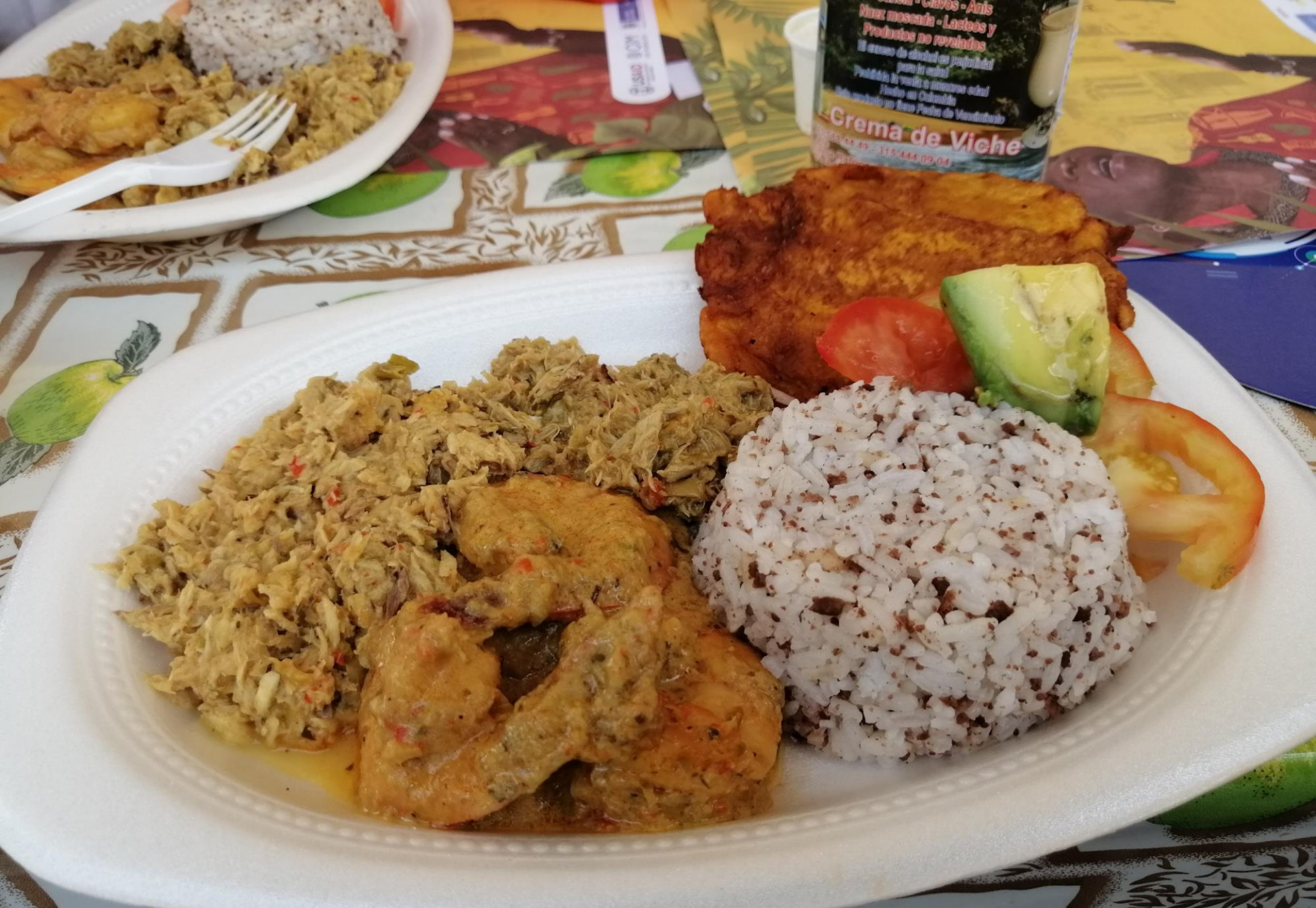
DOS MARES DE TOLLO Y LANGOSTINOS