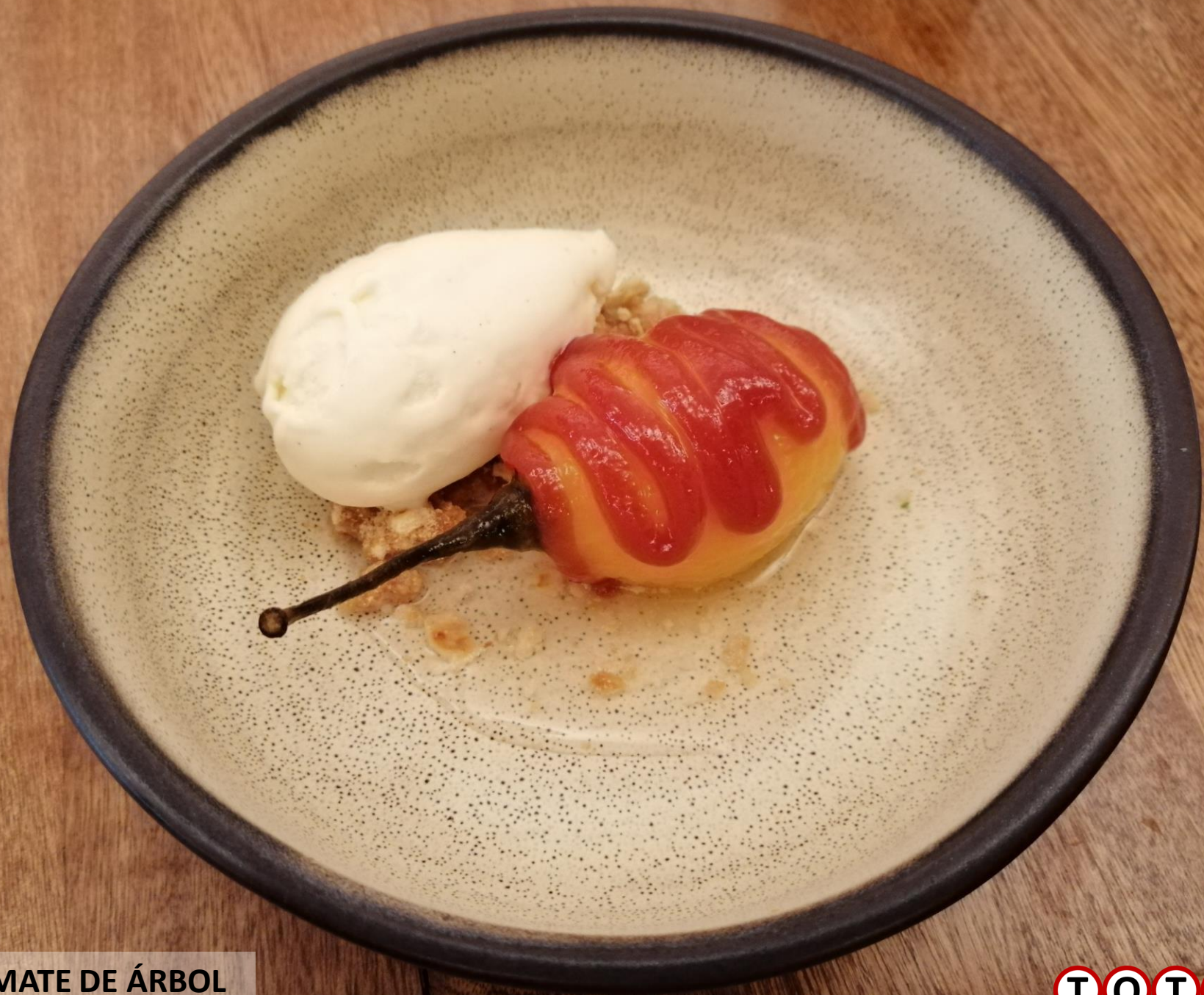
TOMATE DE ÁRBOL