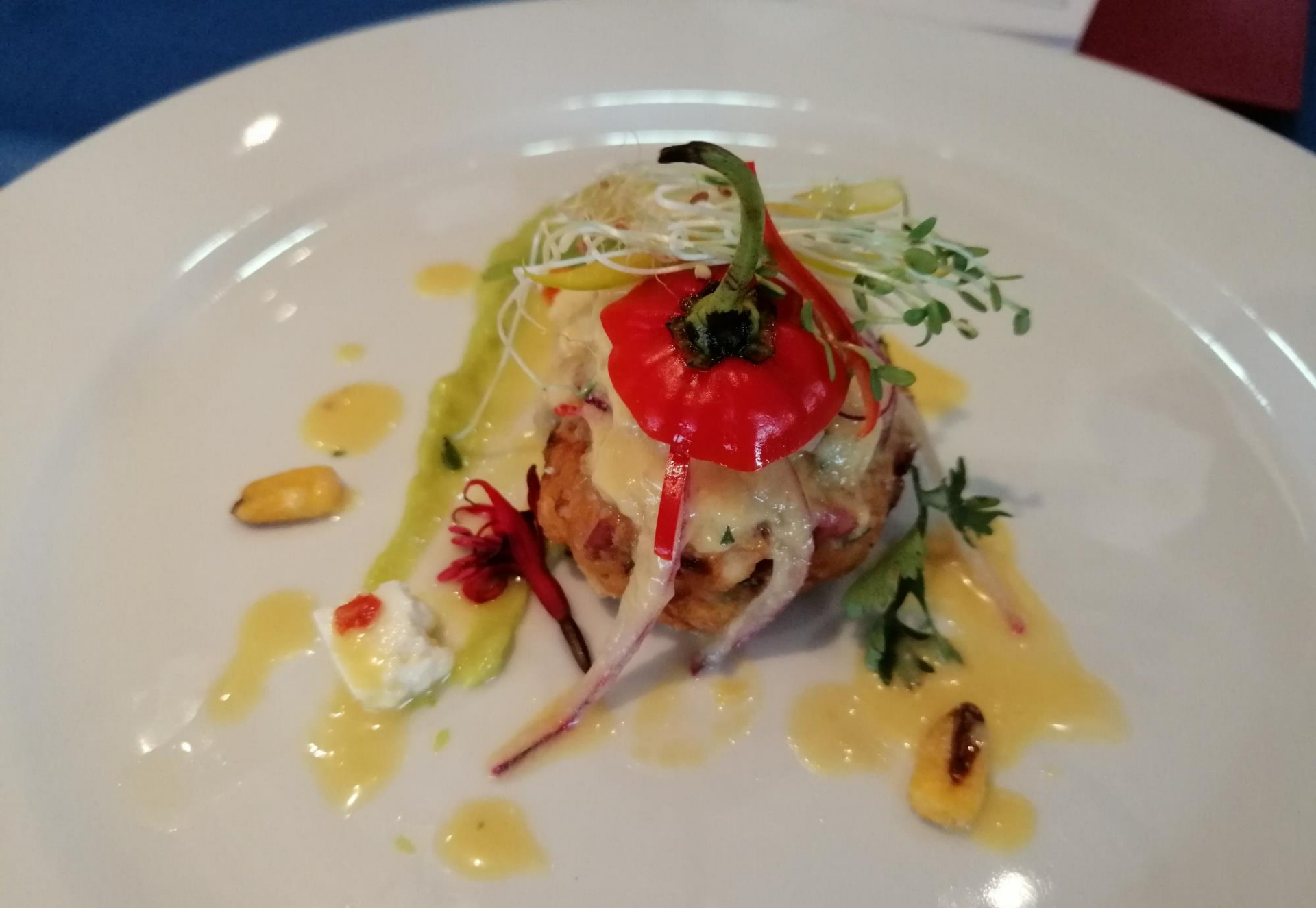
ALBONDIGA DE SALMÓN