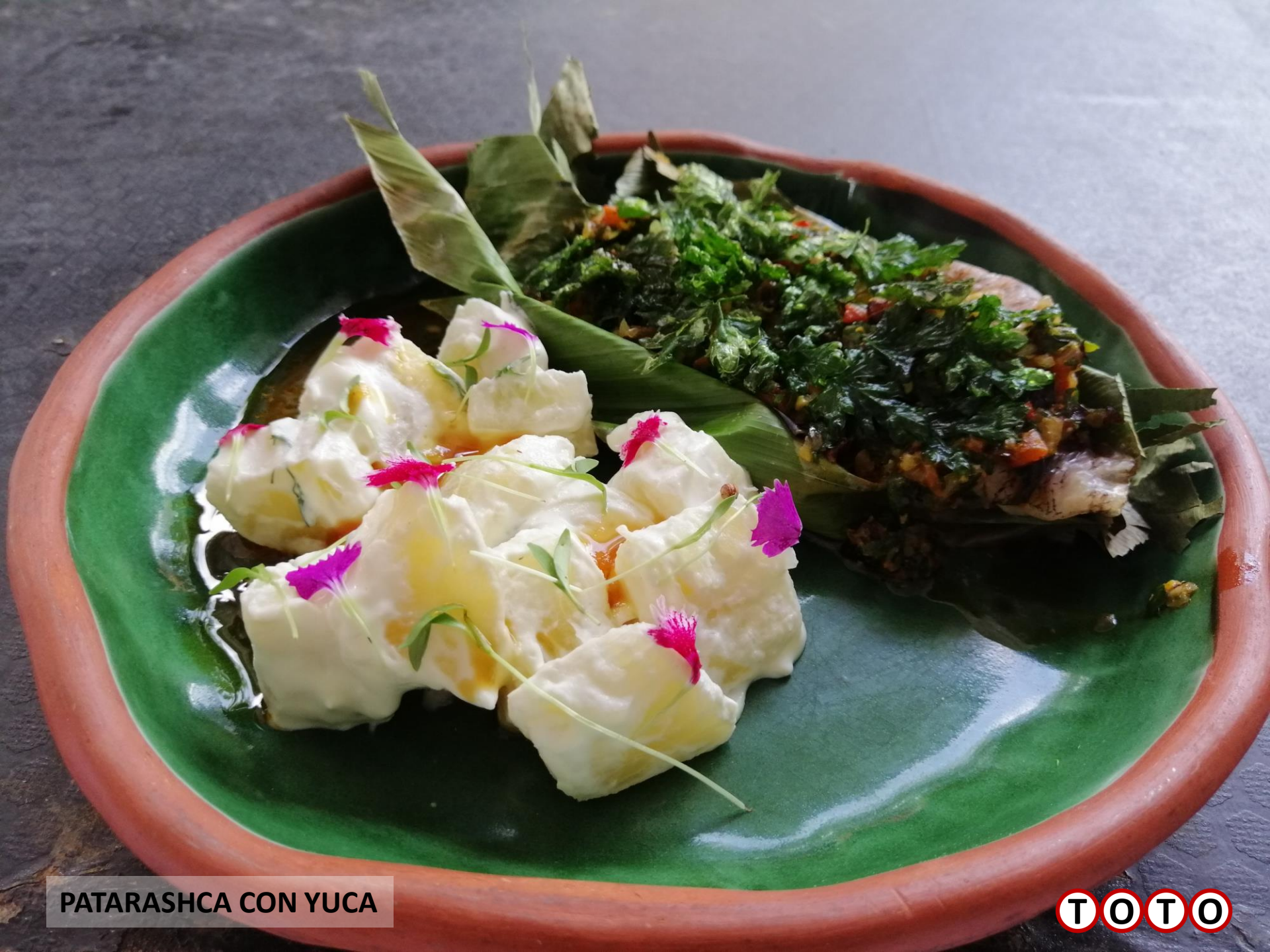
PATARASHCA CON YUCA