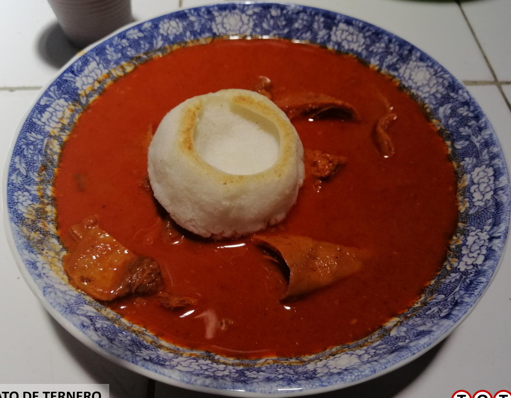
PLATO DE TERNERO