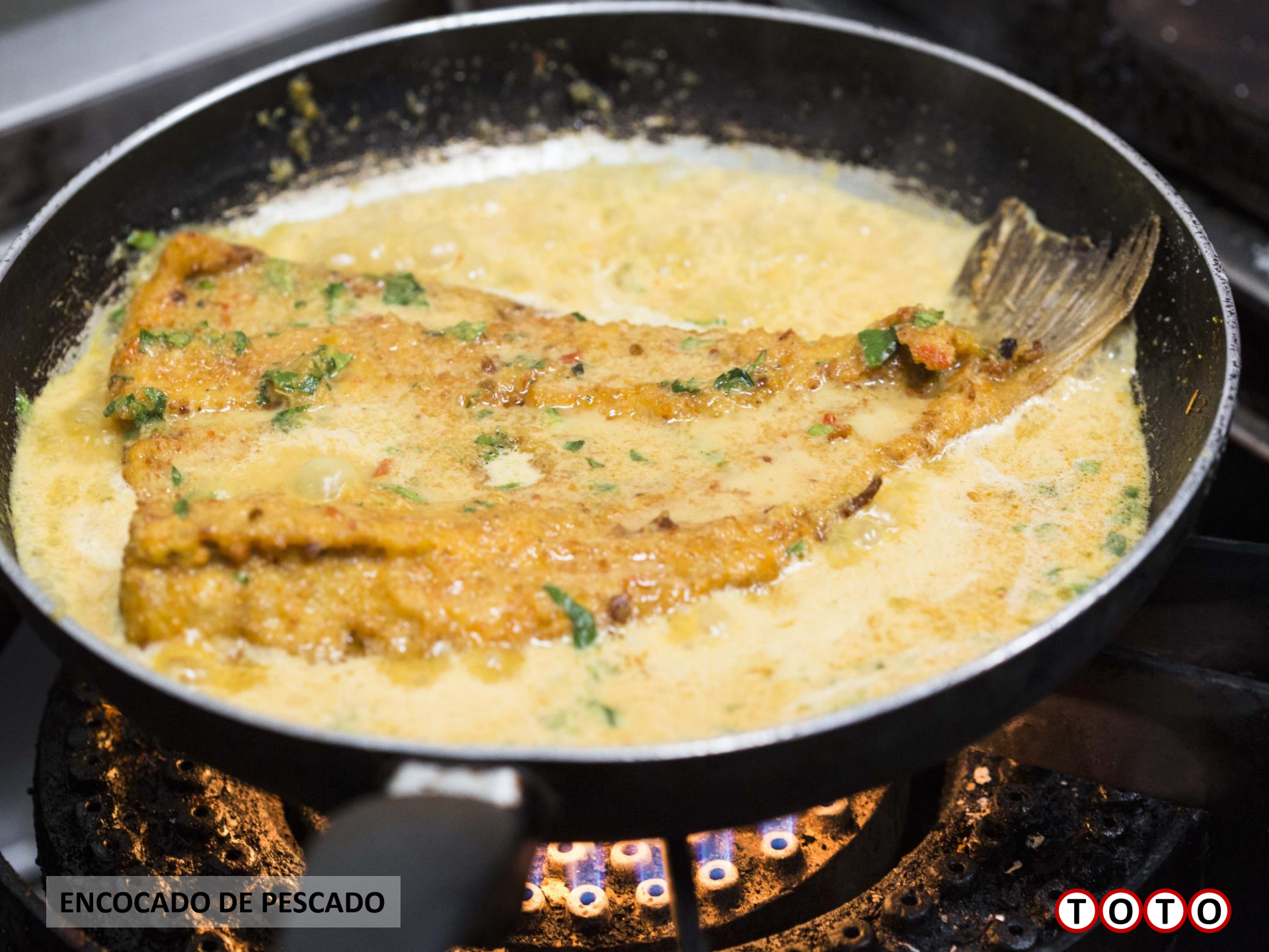
ENCOCADO DE PESCADO