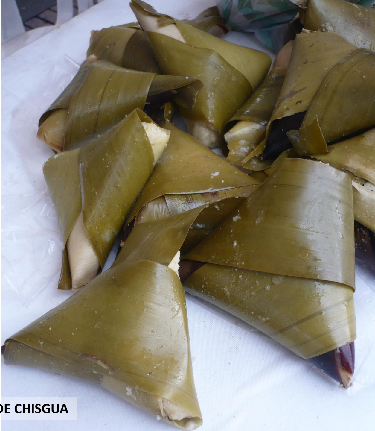
ENVUELTO DE CHISGUA