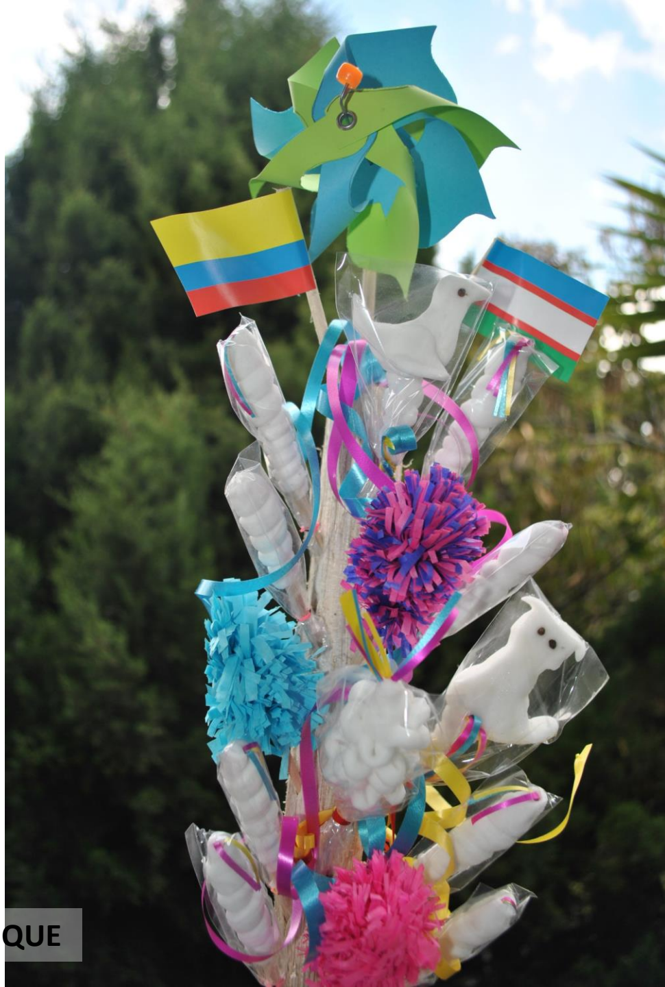
MACETA DE ALFEÑIQUE