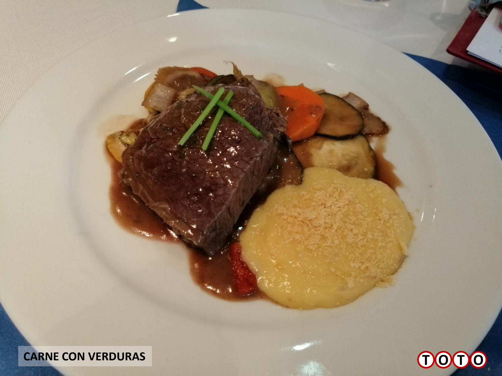
CARNE CON VERDURAS