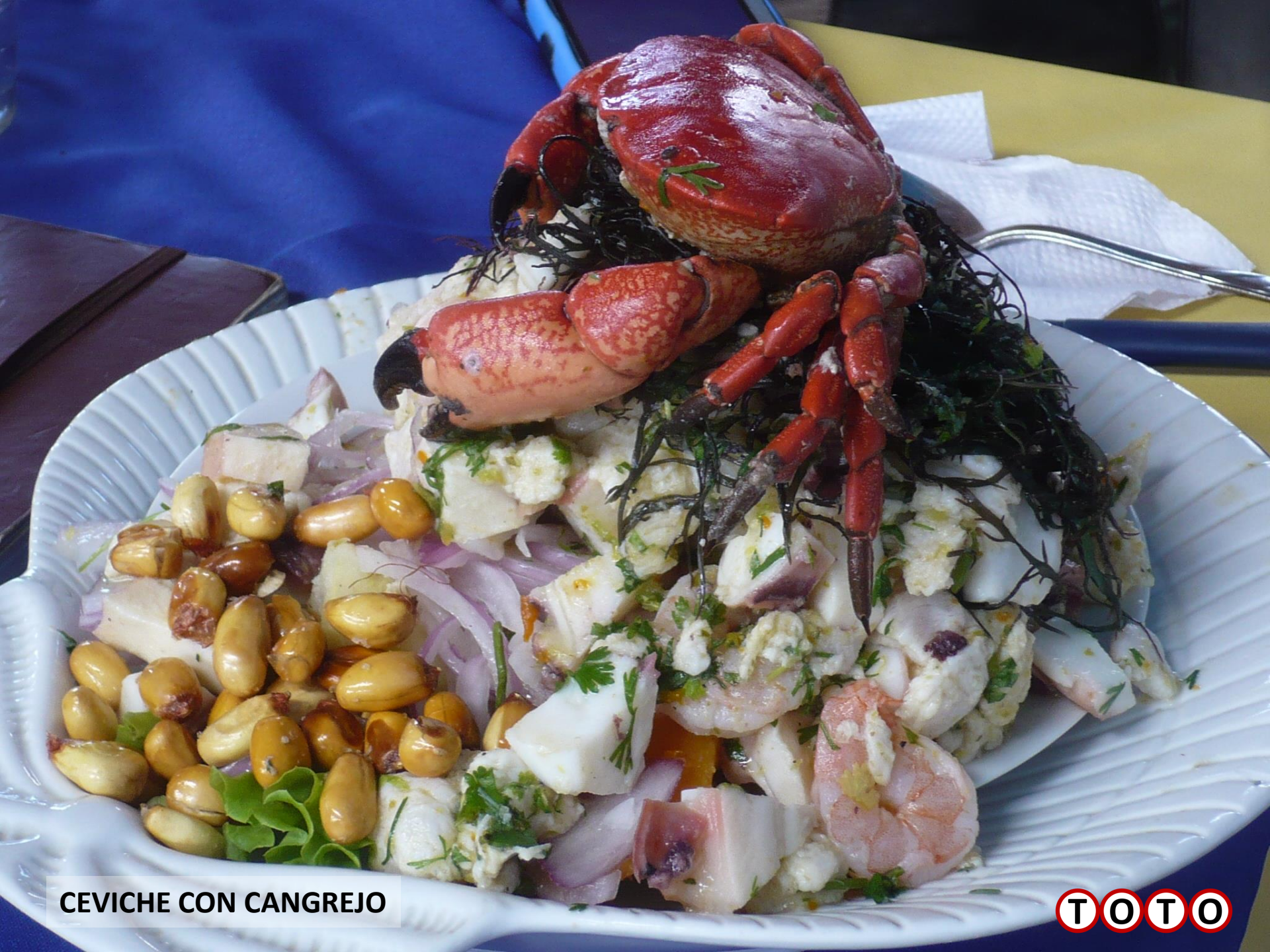
CEVICHE CON CANGREJO