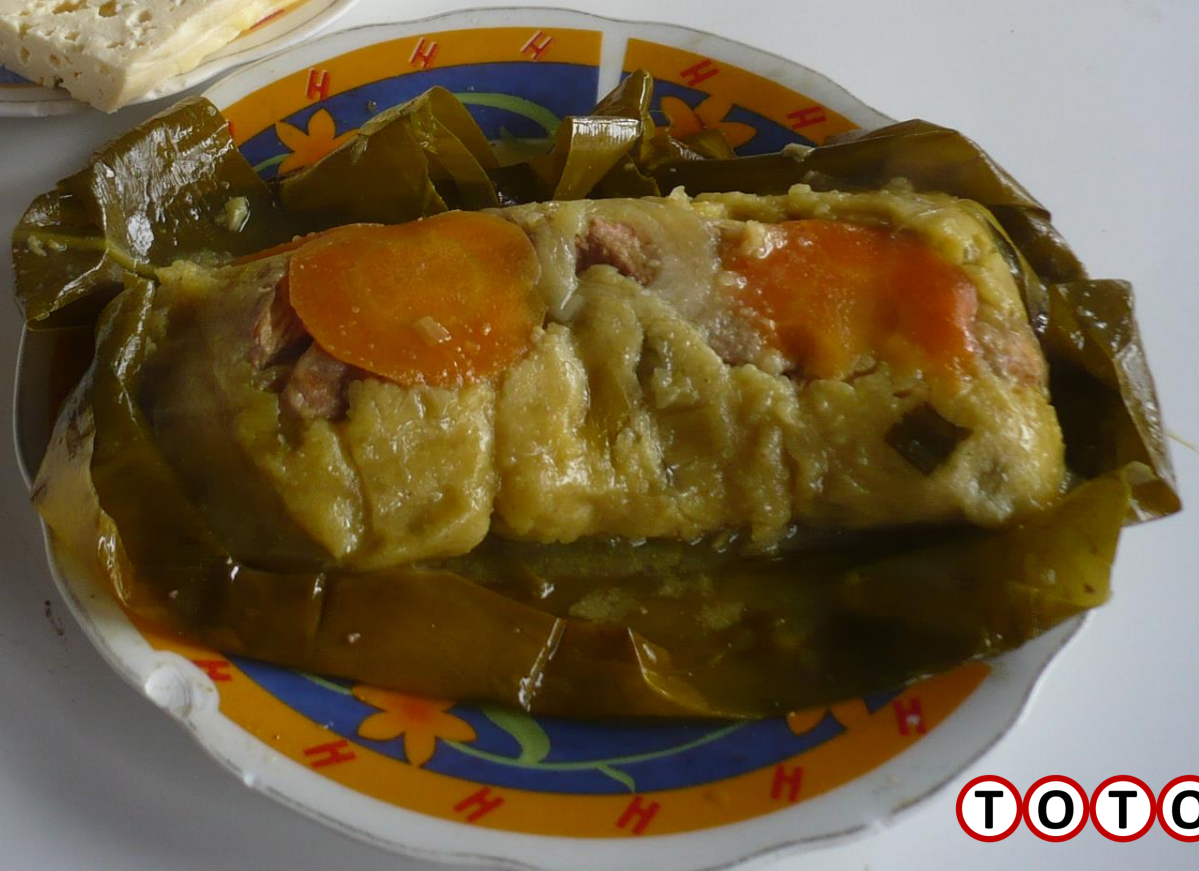
TAMAL CON CHOCOLATE