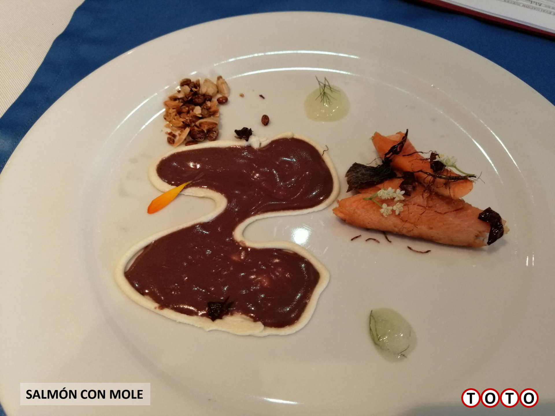
SALMÓN CON MOLE