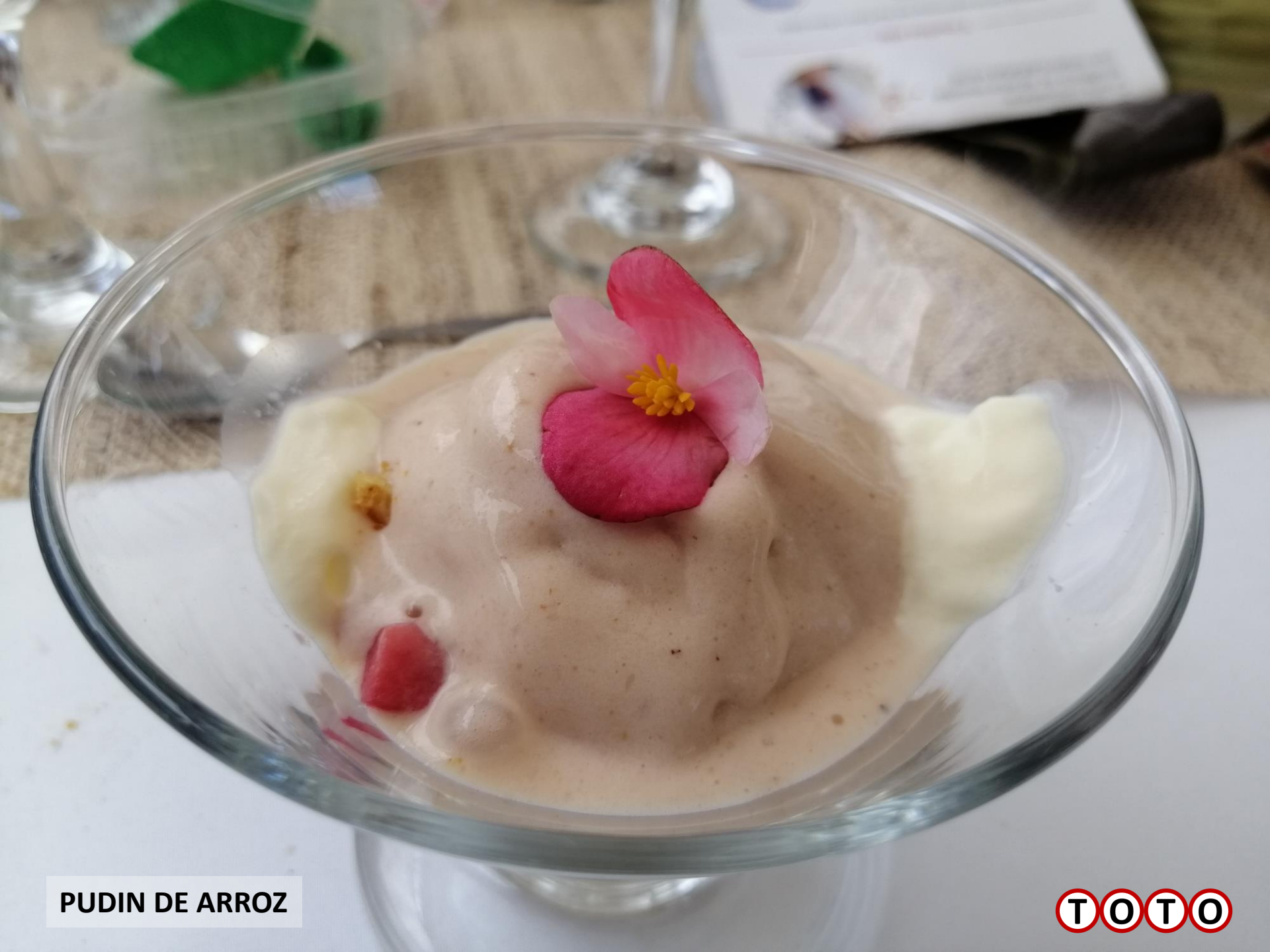
PUDIN DE ARROZ